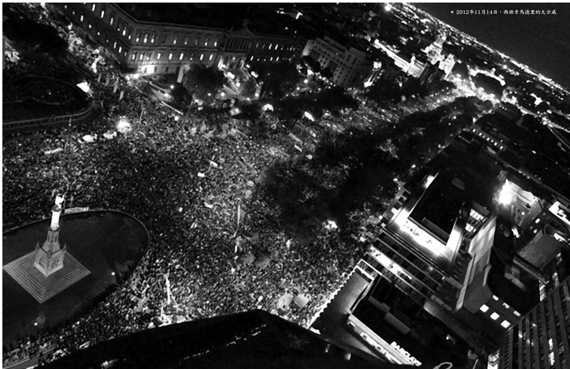
* 2012年11月14日，西班牙馬德里的大示威